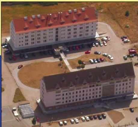
Haus I und Haus II neu